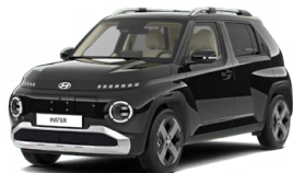
Abyss Black Pearl Perleťová Cena: 12 900 Kč