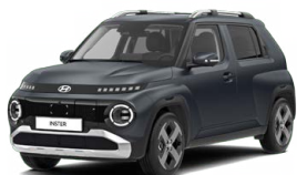
Dusk Blue Matte Matná metalická Cena: 15 900 Kč Nelze pro INSTER Cross, INSTER Cross Premium