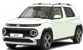
Unbleached Ivory Patelová Cena: 0 Kč