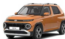
Sienna Orange Metallic Metalická Cena: 12 900 Kč Nelze pro INSTER Cross, INSTER Cross Premium Kombinace dostupná také s černým lakováním střechy