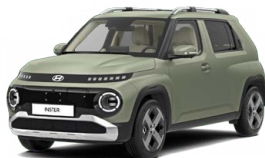
Bijarim Khaki Matte Matná metalická Cena: 15 900 Kč Nelze pro INSTER Cross, INSTER Cross Premium (pouze pro skladové vozy)