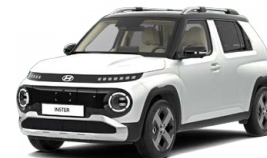
Aero Silver Matte Matná metalická Cena: 15 900 Kč Kombinace dostupná také s černým lakováním střechy