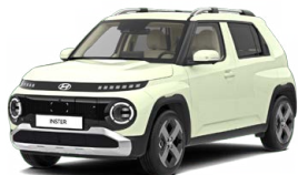
Buttercream Yellow Pearl Perleťová Cena: 12 900 Kč Nelze pro INSTER Cross, INSTER Cross Premium