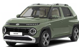
Tomboy Khaki Pastelová Cena: 12 900 Kč Kombinace dostupná také s černým lakováním střechy